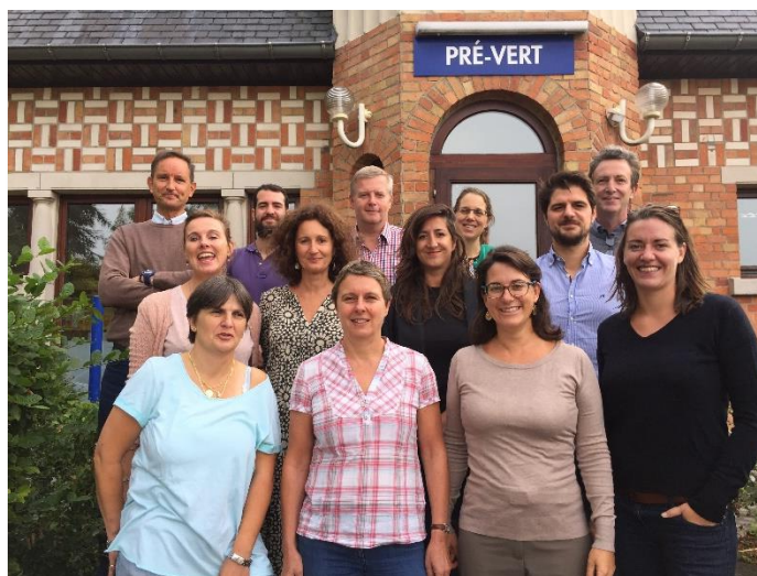
L'équipe de l'APEEE et de l'APEEE Services