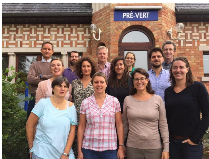
L'équipe de l'APEEE et de l'APEEE Services