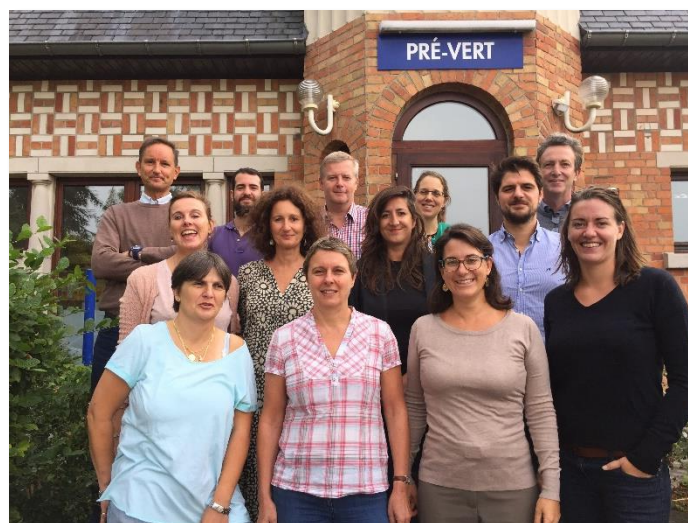
L'équipe de l'APEEE et de l'APEEE Services